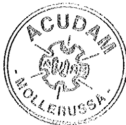
Ramon Vallès Botines